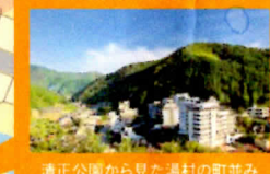
清正公園から見た湯村の町並み